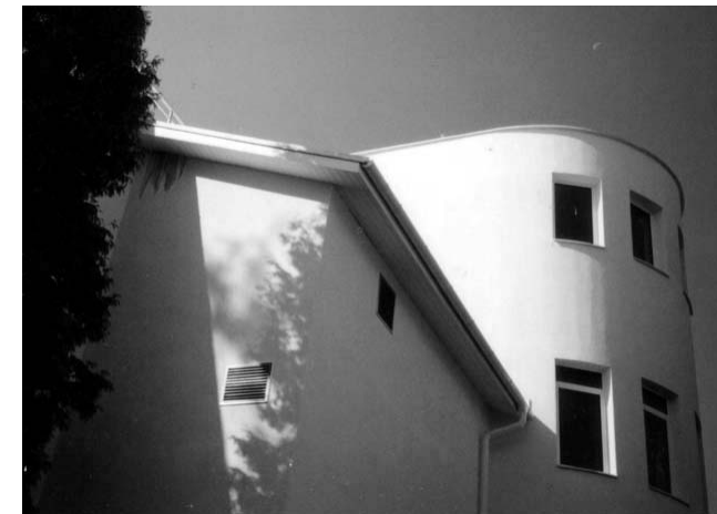
Hvězdárna Zlín (Ing. arch. Ivan Havlíček) jedna z vystavených realizací Grand Prix

Ve zlínské hvězdárně bude výstava otevřena od 4. do 26. září 2004, můžete ji shlédnout v době konání jiných akcí.