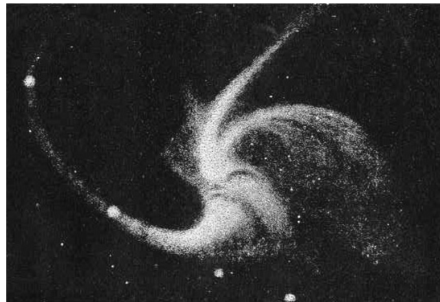
Kresba M33 Williama Parsonse z poloviny 19. století největším dalekohledem tehdejší doby o průměru bronzového zrcadla 180 cm