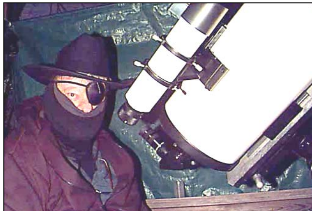
Astronom chystající se na noční pozorování v mrazivé části roku.

Krutý omyl je široce žánrově zaměřená kapela s dechovou sekcí. V jejích procitěných autorských písních se ozývají reakce na písně Michala Davida, stejně jako ozvěny kořenů různé moravské dechovky. Zpívat se bude o zvířátkách, o hvězdách, o koloběžce a dokonce i o jízdě dírou v zemi.