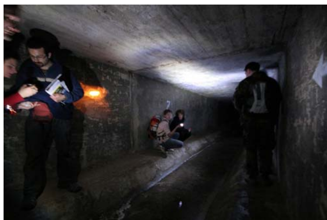
Garáž létajícího autíčka byla v kanále a mířila k poště 760 03...

Pozorování noční oblohy se konají v květnu vždy v pondělí, středu a pátek, začátky v 21 hodin SELČ.