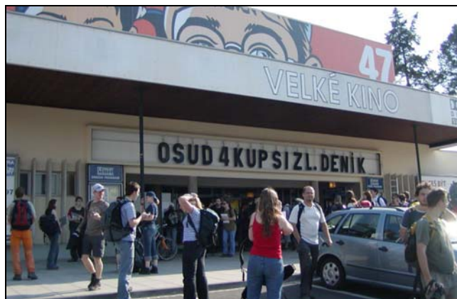
Reportáž a ohlasy z šifrovací hry Od soumraku do úsvitu naleznete na adrese http://www.zas.cz/osud4/