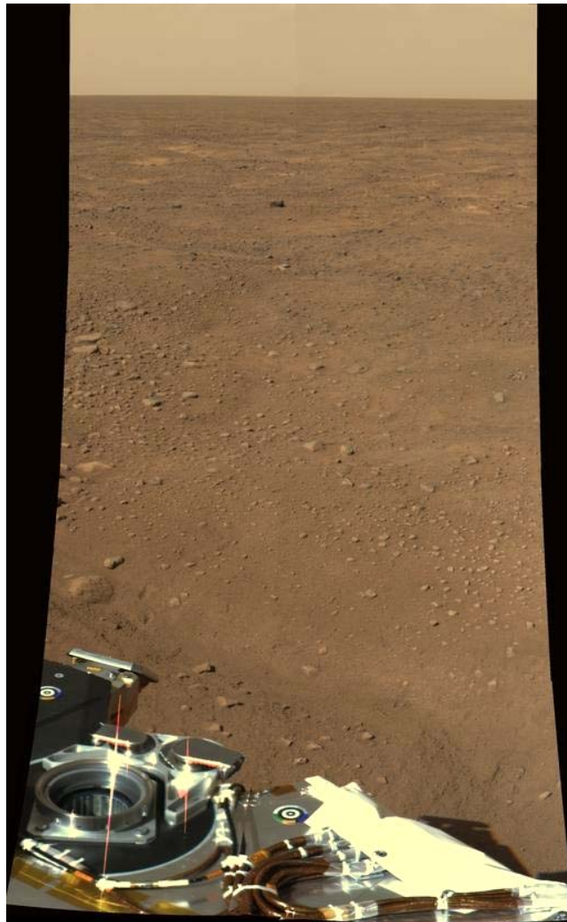
Fotografie z místa přistání. Rovinatý terén je pokryt pískem a kameny. Málokteré jsou větší než 10 cm.

Zpracováno podle: http://phoenix.lpl.arizona.edu/ http://www.nasa.gov/mission_pages/phoenix/main/index.html