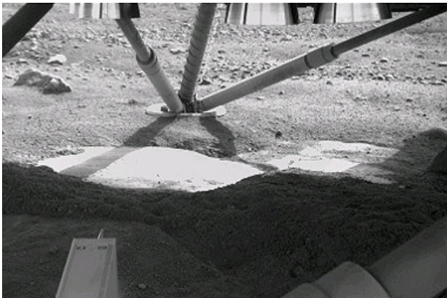
Světlá místa pod Phoenixem. Jde o tvrdé skalnaté podloží, z něhož byl při přistávacím manévru odvátn pískový kryt, nebo o zmrzlou zeminu či snad dokonce o ledovou plochu?

Sonda Phoenix je projektem NASA na kterém se významně podílí univerzita v Arizoně. Projekt je primárně určen k výzkumu historie vody na Marsu. Neméně důležitým bude zjištění, zda jsou na Marsu podmínky vhodné pro život. Nalezení živých organismů v jakékoliv podobě je však spíše zbožným přáním, i když nic nelze vyloučit. Sonda vystartovala v srpnu 2007 a 26.5.2008 v 1:53:44 SELČ byly zachyceny první signály potvrzující úspěšné přistání na povrchu Marsu. Phoenix je od doby Vikingů v sedmdesátých letech minulého století opět projektem, který prověřil možnost měkkého přistání na Marsu. Laboratoř přistála v oblasti nad 68° severní marťanské šířky poblíž kráteru Heimdall. Jde o oblast poblíž severní polární čepičky. Zde by se měla, podle průzkumu sondy Mars Orbiter, v horninách pod povrchem nacházet voda.