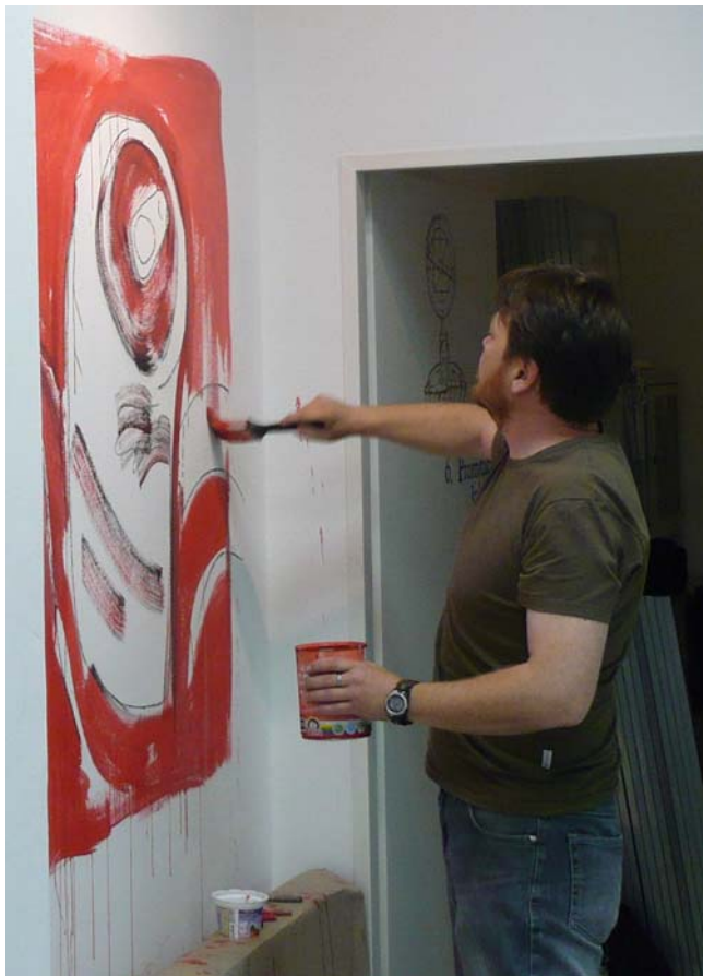
Ivo Sumec: Chybějící obraz, 130 x 160 cm, akryl na stěně, 2008 fotografie z vernisáže