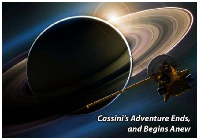
Cassini's Adventure Ends, and Begins Anew

30.června 2008 skončí čtvrtý rok oblévání a vědeckých měření a pozorování mise Cassini u Saturnu a ve světě jeho prstenců a měsíců. V následujícím dvouletém období, o které je mise oproti původním předpokladům prodloužena, by sonda měla sledovat sezónní změny na Titanu a na Saturnu, zkoumat Saturnovu magnetosféru a pokusit se zachytit jedinečný úkaz v srpnu 2009, kdy na Saturnu nastane rovnodennost a Slunce bude viditelné v rovině prstenců. Tato část projektu byla proto příznačně nazvána Cassini Equinox Mission.