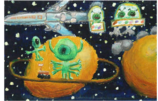
výstava obrázků Vesmíru od dětí z celého světa