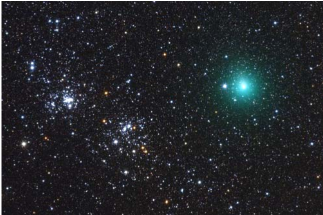
Snímek komety Hartley 2 poblíž otevřené dvojitě hvězdokupy \chi a h v Perseovi. S postupujícím podzimem se kometa na severní obloze posunuje do ranních hodin, klesá přes Jednorozce do Hydry a Velkého psa a dle očekávání poblíž perihelia také zvyšuje svoji jasnost.

Ke kometám se nelétá tak často, jak by se zdálo. Přeci jen se ale ve čtvrtek 4. listopadu 2010 podařilo přidat k dřívějším nemnohým návštěvám komet další úspěšný těsný průlet, tentokrát kolem jádra komety 103P/Hartley 2. Kometa Hartley 2 byla objevena v roce 1986 Malcomem Hartleym v Siding Spring v Austrálii. Její oběžná doba byla určena na 6,46 roků, jde tedy o krátkoperiodickou kometu, která doletne od Slunce nanejvýš do vzdálenosti, ve které obíhá planeta Jupiter. Přesná měření charakteristik komety byla prováděna nejrůznějšími metodami. Spitzerovým kosmickým dalekohledem bylo zjištěno, že průměr jádra by se měl pohybovat něco málo přes jeden kilometr, albedo bylo změřeno na 0,028 \pm 0,009 . Velkým překvapením proto bylo, že podle emise molekulární vody změřené SST v hodnotách 3 \times 10^{28} molekul s^{-1} , by to při tak malém jádru nutně znamenalo výtrysky vytvářející komu z celého povrchu jádra, a to dokonce i v aféliu, poblíž kterého se kometa právě nacházela. Prozatím nebyla známa jiná tak aktivní kometa. Pro srovnání na kometě 9P/Tempel 1, kterou sonda Deep impact navštívila v roce 2005, byla tryskajícími proudy z jádra aktivní jen zhruba jedna pětina povrchu a ani u ostatních blíže známých kometárních jader nebylo zatím nikdy jádro natolik aktivní.