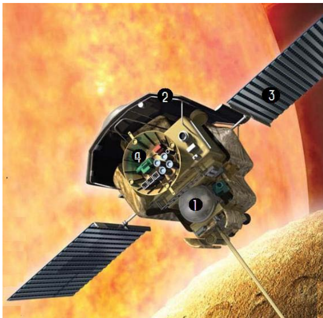
Kosmická sonda Messenger nad povrchem Merkuru v záři Slunce. Celá sonda je proti intenzivnímu slunečnímu větru chráněna stínícím štítem (2).

Kosmická sonda Messenger, vytvořená pro průzkum Merkuru, odstartovala ze Země 3. srpna 2004. Na oběžnou dráhu kolem Merkuru se dostala po několikanásobném urychlení prostřednictvím těsných průletů kolem Země (2005) a Venuše (2006 a 2007). Po následných třech těsných průletech kol Merkuru (14. 1. 2008, 6. 10. 2008 a 29. 9. 2009) začala obíhat 18. března 2011 přímo kolem cílové planety. Sonda je navržena tak, aby vydržela pracovat v extrémních podmínkách v blízkosti Slunce. Je vybavena přístroji pro snímkování povrchu, studium geologických charakteristik, měření velmi tenké atmosféry a magnetosféry.