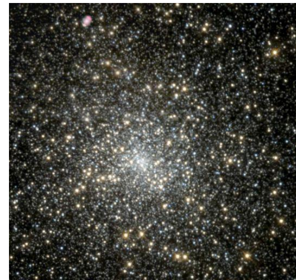
Kulová hvězdokupa M15 v souhvězdí Pegas