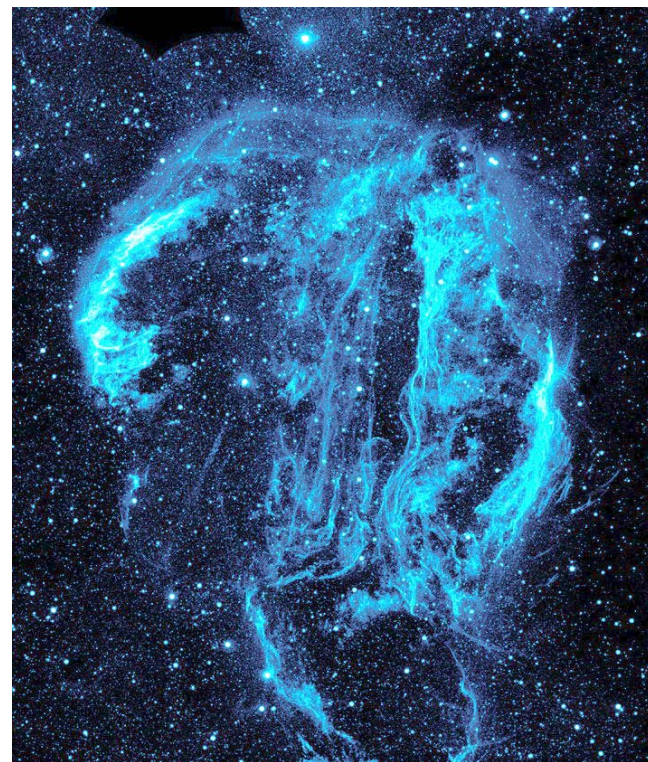
Rasová mlhovina v souhvězdí Labutě