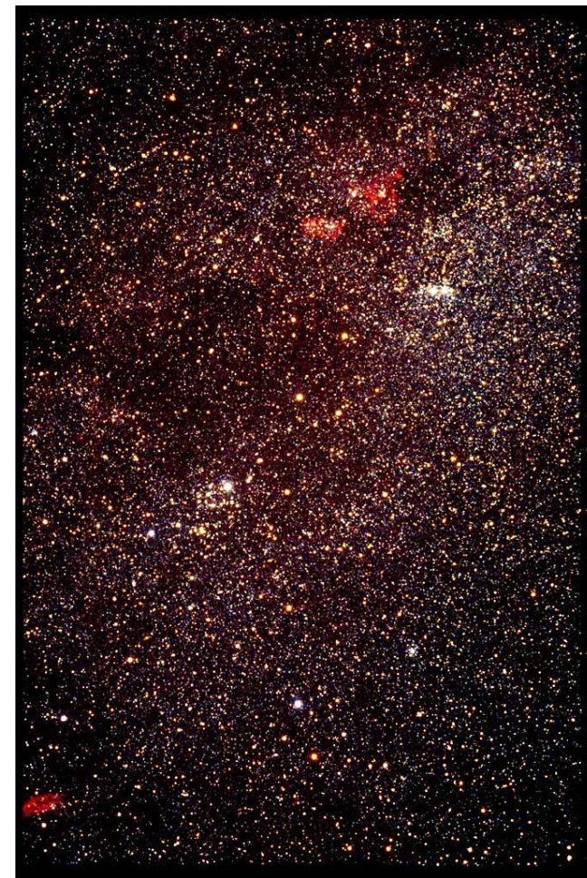
Mléčná dráha v souhvězdí Persea