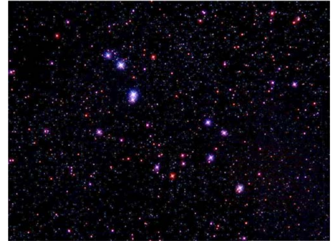
Asterismus Ďáblův pes mezi hvězdokupami Plajády a Hyády v souhvězdí Býka