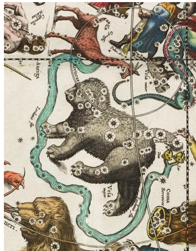
Nebeská řeka Jordán – souhvězdí obtékající Velkou medvědičku, které se již na dnešních hvězdných mapách nenachází.