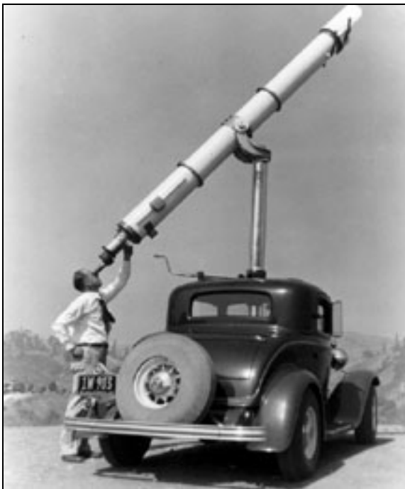
Refraktor o průměru 9,5" Zeissovy výroby, se kterým pozoroval Shelly Stody z Whittieru v Kalifornii. Tento pojízdný dalekohled vozil na střeše svého auta více než dvě desetiletí. Fotografie je z roku 1933.