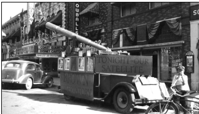
Pojízdne hvězdárny byly ve třicátých letech téměř na úrovni pouťových atrakcí. Fotografie devítipalcového dalekohledu Brownovy nadace šířící osvětlu v Idaho je z roku 1939