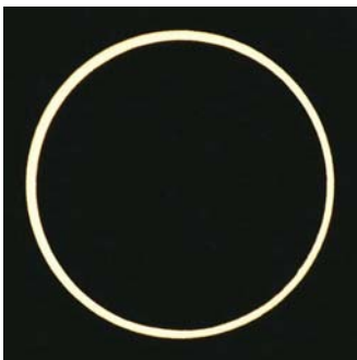
Slunce a Měsíc 3.10.2005 v 9:01:20 UT