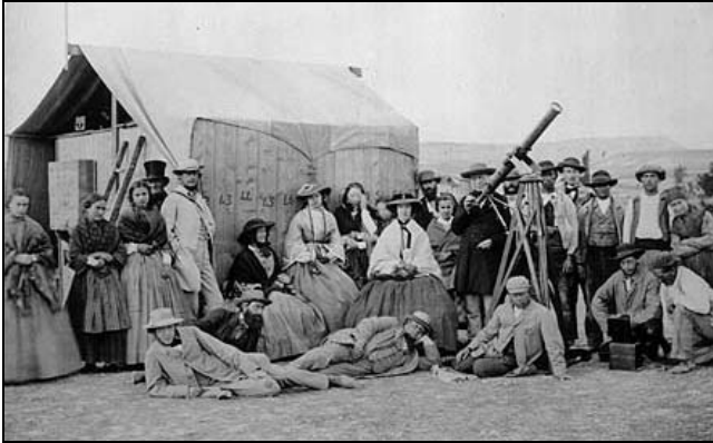
Expedice Královské astronomické společnosti za slunečním zatměním do Rivabellosy ve Španělsku 18. července 1860