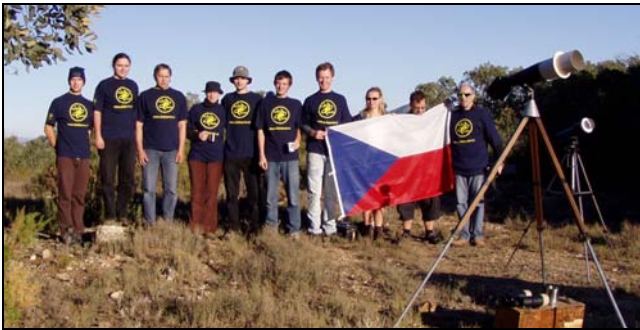
Expedice sdružení Aldebaran za slunečním zatměním ve Španělsku 3. října 2005