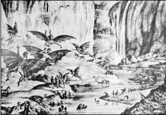
Měsíčané poletující nad měsíčními vodopády

Pod vlivem nadějného rozvoje velkých astronomických přístrojů v počátcích 19. století a také ve snaze zvýšit prodejnost listu počala v deníku New York Sun vycházet 25. srpna 1835 reportáž na pokračování „Čerstvé astronomické objevy právě provedené Johnem Herschelem na Mysu dobré naděje“. Autorem mystifikace byl Richard Adams Locke, který v údajných Herschelových objevech popisoval velmi podrobně život Měsíčanů.