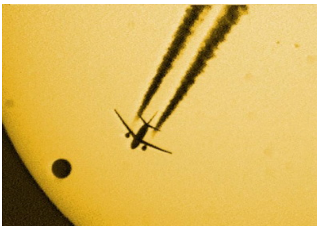
Přechod Venuše přes sluneční kotouč vyfotografovaný 8. června 2004 spolu s prolétajícím letadlem

Ve středu 6. června 2012 ve 2 hodiny ráno se bude nacházet planeta Venuše v dolní konjunkci a dojde k výjimečnému úkazu, jehož pozorování si nebudeme následujících 105 let moci dopřát, a to k přechodu Venuše přes sluneční kotouč. Jedná se v podstatě o zákryt jednoho tělesa sluneční soustavy jiným, o jakési „zatmění Slunce“ Venuší. Ovšem vzhledem ke vzdálenosti Země a Venuše budeme na slunečním disku pozorovat pouze pomalu se pohybující černý kotouček. Za pomoci vhodného filtru (nejlépe svářečský filtr č. 13) tento úkaz uvidíme i pouhým okem. Z našeho území bude pozorovatelný pouze konec úkazu (poslední 2 hodiny), neboť u nás Slunce v jeho průběhu vychází. Slunce bude nízko nad obzorem a pozorovací podmínky zdaleka nebudou optimální, přesto by bylo škoda se o sledování tak vzácného jevu alespoň nepokusit.