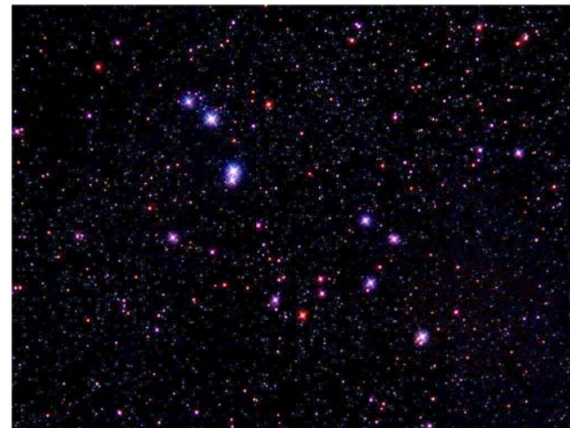
Asterismus Ďáblův pes mezi hvězdokupami Plajády a Hyády v souhvězdí Býka