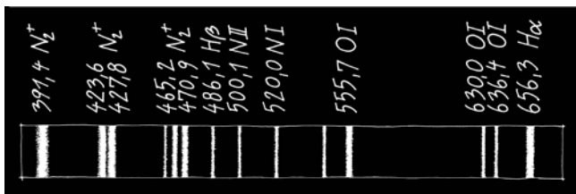
spektrum polární záře ve viditelné oblasti světa

Pozorování noční oblohy se konají v březnu vždy v pondělí, středu a pátek od 19:00 do 21:00 hodin.